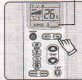
Код перестал мигать