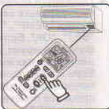
Код перестал мигать